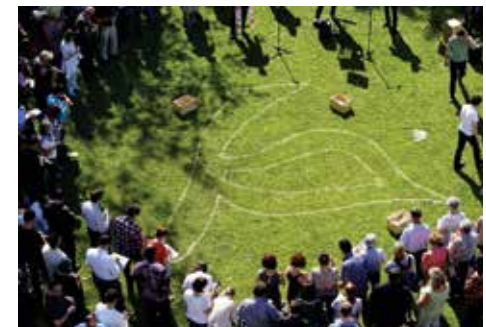
In christlichem Geist innovieren