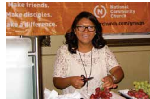
Von lebendigen Gemeinden lernen